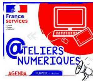
MAD Murviel Les Béziers

Le 10/09/2020 - De 14 h 30 à 16 h 30. ATELIER NUMÉRIQUE DÉBUTANTS MURVIEL-LES-BEZIERS