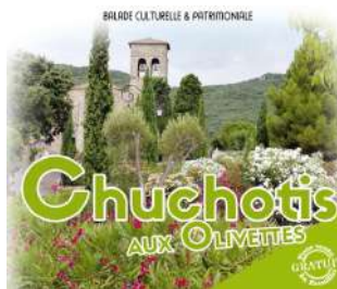
Services Culturels des Avant-Monts

Le 19/09/2020 - A 14 h 30 sur la place du village. BALADE CULTURELLE & PATRIMONIALE "CHUCHOTIS AUX OLIVETTES" VAILHAN