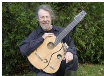
CHATEAU ABBAYE DE CASSAN

Le 05/09/2020 - à 20h30 FESTIVAL DE MUSIQUE CLASSIQUE DE BARDOU "JAMES KLINE" ROUJAN