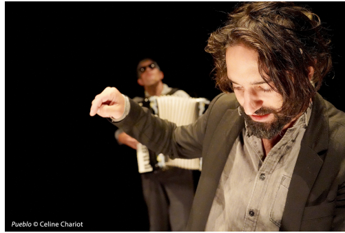
Pueblo © Celine Chariot